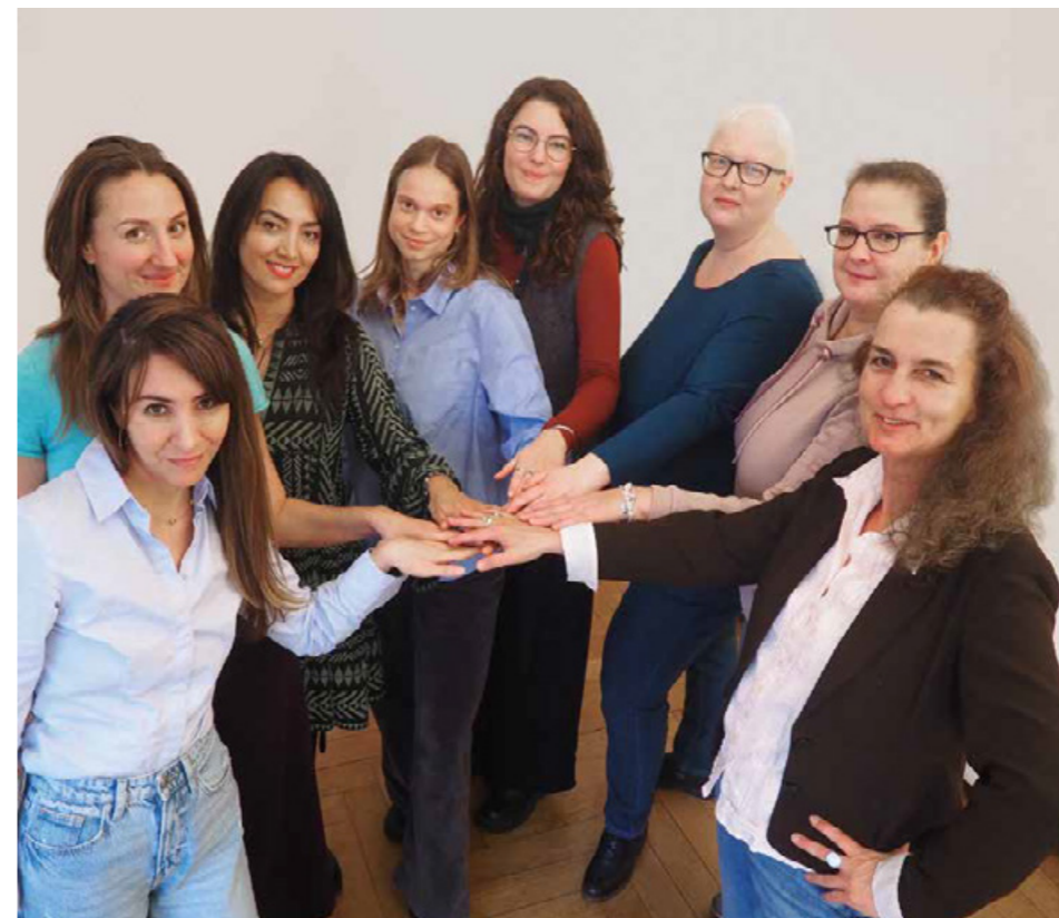
Ein starkes Team – Frauen* für Frauen*

Hilfe zur Selbsthilfe: Wir weisen ausdrücklich darauf hin, dass wir nicht diagnostizieren, keine Behandlungen durchführen, keine Medikamente empfehlen oder verschreiben und keine heilkundlichen Tätigkeiten ausüben. Für medizinische Abklärung, Diagnostik oder Zweitmeinungen verweisen wir grundsätzlich an Ärzt*innen. Im Zentrum unserer Arbeit steht demnach die Hilfe zur Selbsthilfe. Wir stärken Frauen* darin, eigene Strategien zu entwickeln, Informationen einzuordnen und selbstbestimmte Entscheidungen zu treffen.